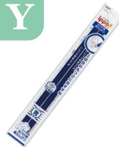
丸つけ用 青えんぴつ 2本パック