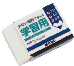
学習用モノ消しゴム