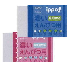
濃いえんぴつ用 消しゴム