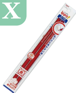
丸つけ用 赤えんぴつ 2本パック