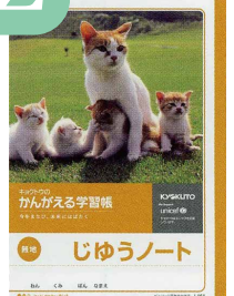
じゅうノート 無地